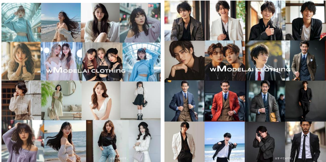
様々なスタイルに対応、EC用画像、SNS用画像、表現力無限大（背景、シチュエーションも自由自在）