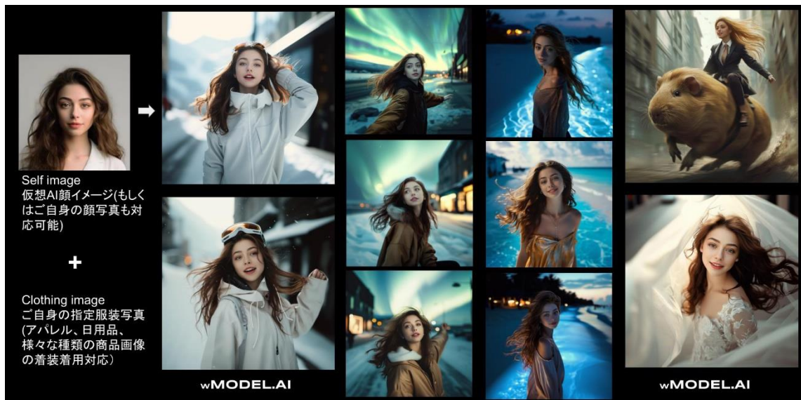
1枚の元の商品画像→AIモデルが着用した画像を生成